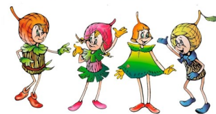
Эколята - Молодые защитники Природы

Юные эколята нашей Школы достигли впечатляющих результатов: 4 победителя и 5 призёров в викторине.